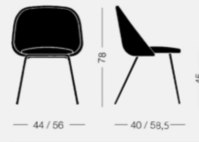
Spoon 0C83 7,5 kg 0,31 m 3 2 pz Sedia, struttura in acciaio Chair, steel base

Seat collection in steel with polyurethane foam backrest upholstered in fabric, leather or eco-leather.