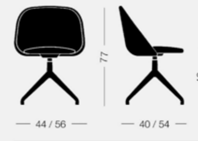
Spoon 0C84 7,5 kg 0,31 m 3 2 pz Sedia, base girevole Chair, swivel base